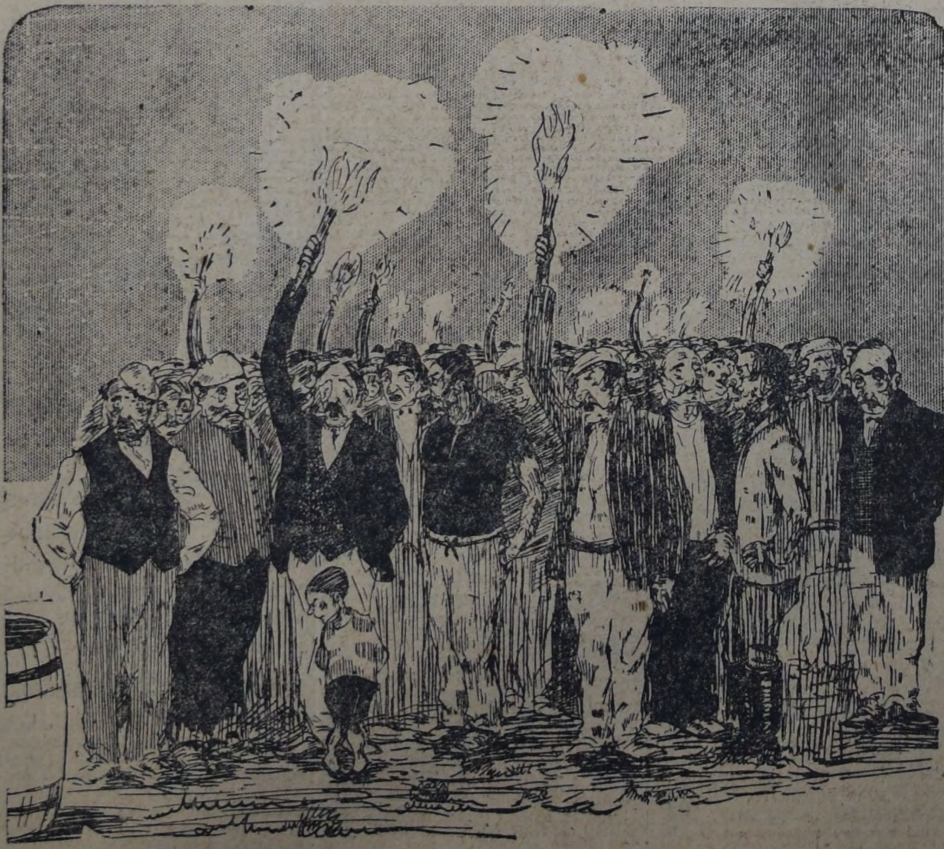
“Por El y por la ‘causa’ juramos reconquistar... el presupuesto”